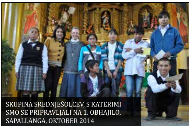
SKUPINA SREDNJEŠOLCEV, S KATERIMI SMO SE PRIPRAVLJALI NA 1. OBHAJILO, SAPALLANGA, OKTOBER 2014