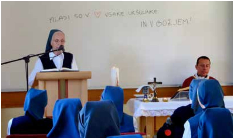
SREČANJE Z ŽIVIM BOGOM V BOŽJI BESEDI IN EVHARISTIJI