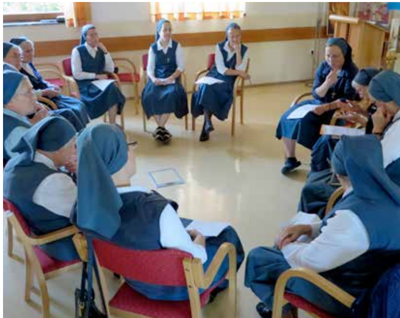
POGOVOR PO SKUPNOSTIH