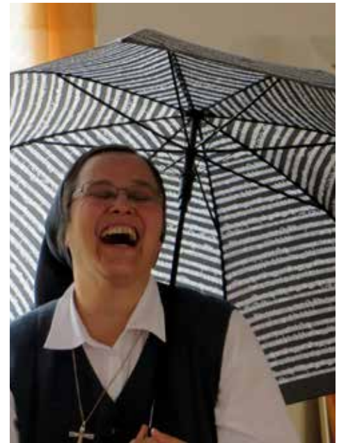
VESELJE JE BOŽJI DAR