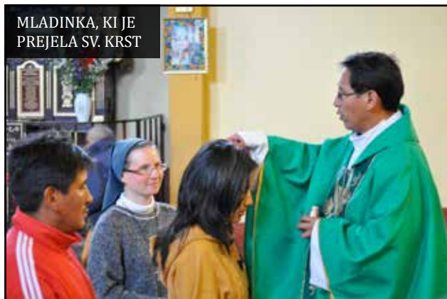
MLADINKA, KI JE PREJELA SV. KRST

Sina« (Pravilo, Uvodna beseda, 5.7). Sv. Angela je svoj vir veselja našla pri Jezusu. On sam nam pravi: »To sem vam povedal, da bo moje veselje v vas in da bo vaše veselje dopolnjeno« (Jn 15,11). In kaj je tisto, kar nam Jezus pripoveduje, da bi nas napolnilo z veseljem? To je vesela novica, evangelij, Njegovo življenje. Lahko ga preberemo v Svetem pismu.