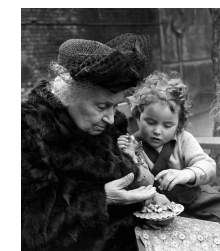
MARIA MONTESSORI, 1870-1952