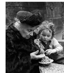
MARIA MONTESSORI, 1870-1952