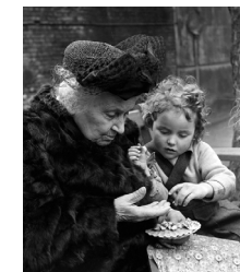
MARIA MONTESSORI, 1870-1952